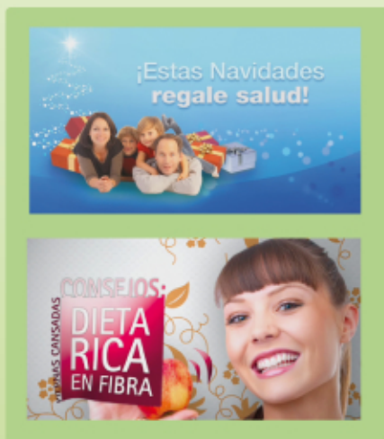
Contenidos de temporada.

Cada mes ponemos a tu disposición una parilla de comunicación, pensada y adecuada según la tipología de tus clientes, con total posibilidad de personalización según los objetivos comerciales de tu farmacia.