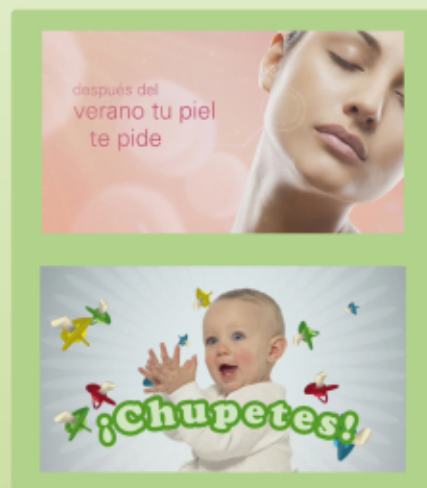
Una temática por cada grupo de clientes.